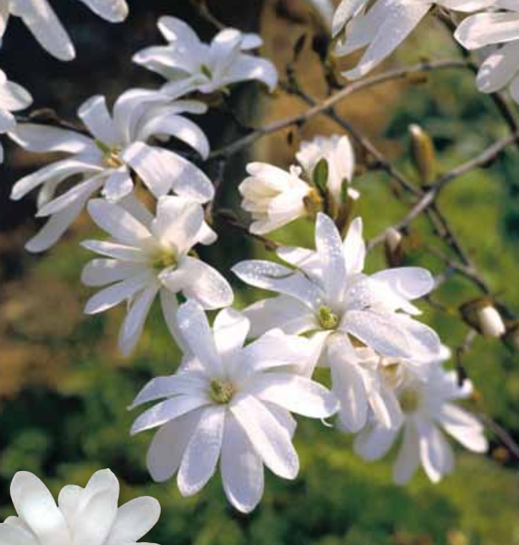
Stjärnmagnolia - Magnolia stellata