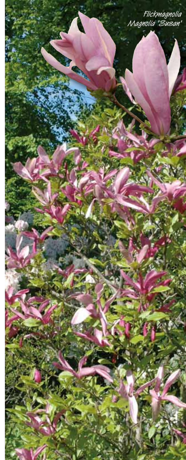
Flickmagnolia Magnolia 'Susan'

Man beskär endast Magnolior om det är nödvändigt och med varsamhet. De får inte beskäras hårt, man kan gallra några få grenar åt gången. Bästa tid är juli, augusti och september.