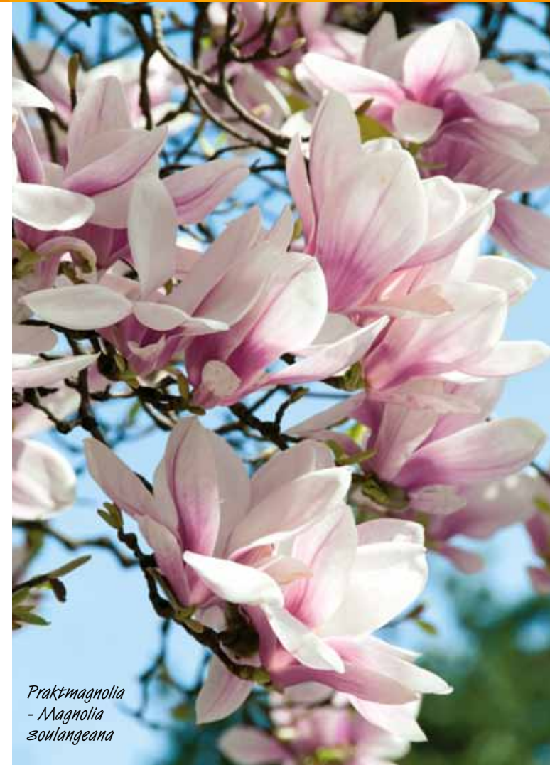
Praktmagnolia - Magnolia soulangeana